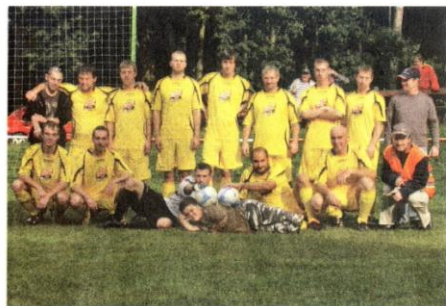
FOTBALOVÝ ODDÍL TJ Sokol Hlohová.

V současnosti však obec začala úspěšně prodávat stavební parcely a Šimka proto doufá, že se časem zvýší i počet dětí v obci a Hlohovští budou moci opět založit žákovské družstvo. „Hlohovská kopaná byla od svých počátků v dobrých i špatných časech spjata s obcí, takže když se bude dařit obci, bude se dařit i hlohovské kopané,“ dodal na závěr. (seb)